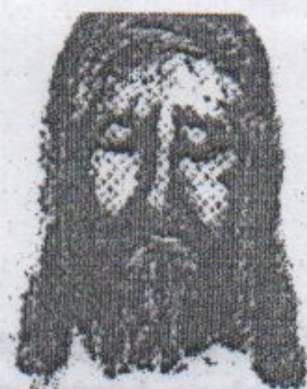
"Senhor mostra-nos a vossa Face e seremos salvos". (salmo 74)